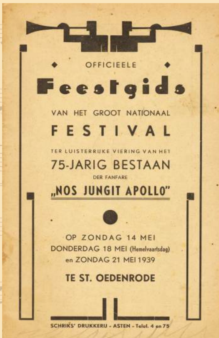
Feestgids bij het 75-jarig bestaan.

Kleinere jubilea, zoals het 10-, 12 1/2- en 20-jarig bestaan werden bijzonder herdacht, maar het klapstuk werd wel het 25 jarig bestaan. Men heeft hierover een apart notulenboek gemaakt, maar dit is blijkbaar verloren geraakt. De secretaris notuleerde het echter ook in het kort in zijn gewone notulenboek, onder het jaar 1890. Hij begint met de volgende ontboezeming: "Weder is een jaar verzwolgen in den eeuwigen oceaan des tijds, een jaar dat voor Nos Jungit Apollo het meest betekenisvolle is geweest sedert het bestaan van het gezelschap".