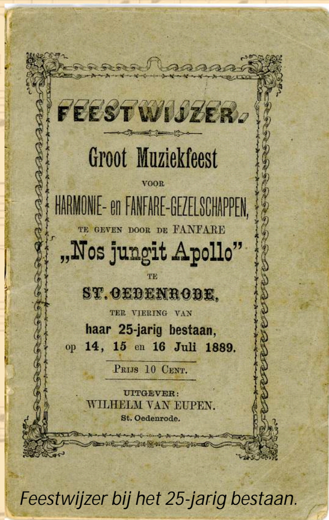
Feestwijzer bij het 25-jarig bestaan.

Op de vergadering van 25 oktober 1877 besprak men de komende teerdag met worstbroodjes en bier. De beschermheer merkte