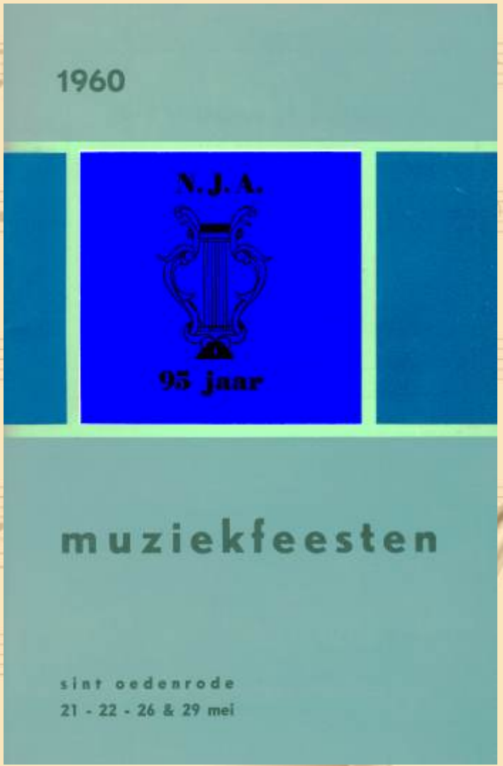
Muziekfeesten bij het 95-jarig bestaan.