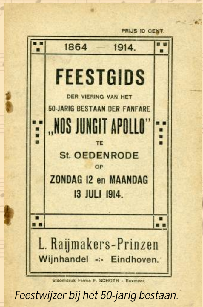
Feestwijzer bij het 50-jarig bestaan.