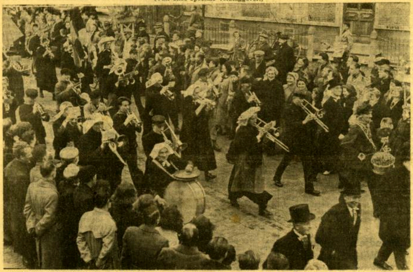
SINT OEDENRODE, 20 Febr. In de drullende regen draafden de ruiters van Sint Oedenrode door het dorp, Woensdagmorgen tegen negen uur. Ze draafden naar de Kerkstraat, naar het oude gasthuis en bij een blauw-gele ereboog staken zij de trompet. Twee oude mensen in hun klein huilke hebben dat gehoord. Zeventig jaren geleden werd er niet op de trompet geblazen toen zij naar de kerk liepen om daar elk een taf man en vrouw te nemen volgens het gebruik van onze Moeder de H. Kerk.